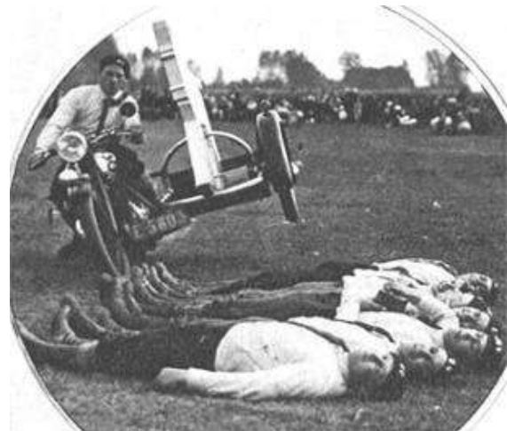
'Kunstrijden' volgens de Z.M.C.