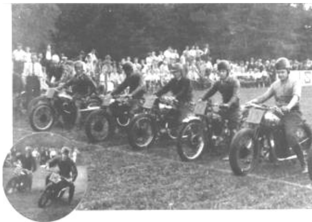
Races in 1936 op de Vloedbelt. Grote foto: aan de start. Inzet: vol gas door de bocht