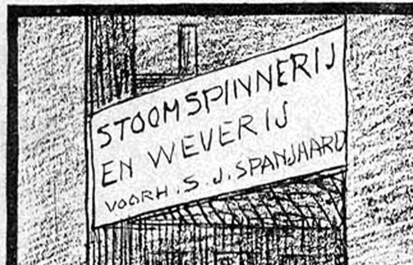
Een detail uit de voorgaande spotprent; duidelijk is te zien om welk bedrijf het gaat