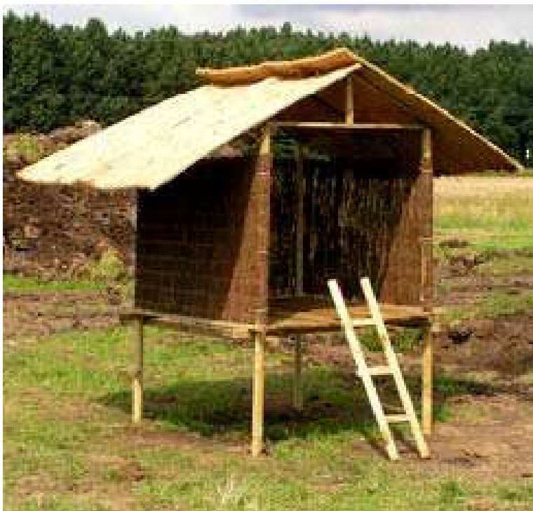
Een reconstructie van een spieker

wege het veelal ontbreken van urnen en bijgiffen. Daarnaast zijn de graven vaak relatief ondiep en daardoor erg kwetsbaar voor bodemingrepen. Als gevolg hiervan zijn vermoedelijk veel graven en complete grafvelden uit deze periode reeds in het verleden verdwenen.