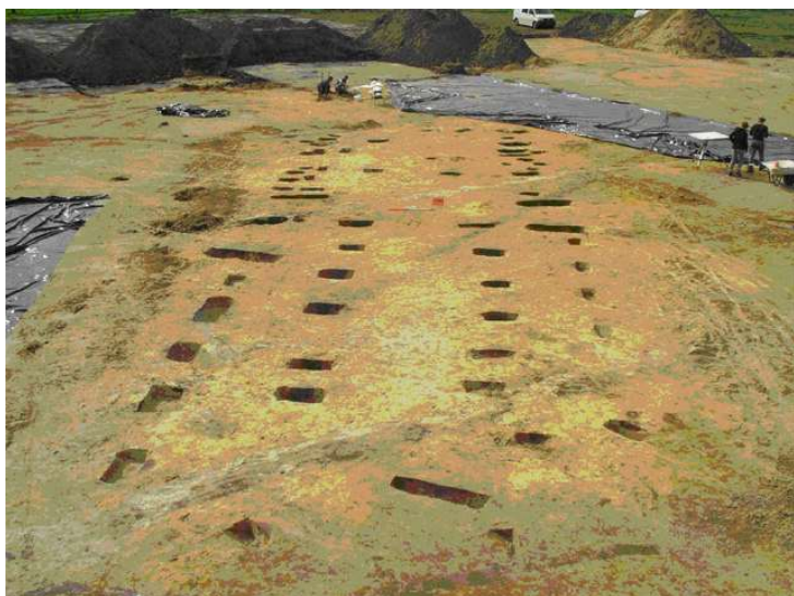
Een nederzetting uit de late ijzertijd en vroeg-Romeinse tijd (150 v. Chr. / 100 na Chr.) zoals die in de Bornsche Maten is blootgelegd.

Hijken, de Hijken-variant en Fochtelloo.