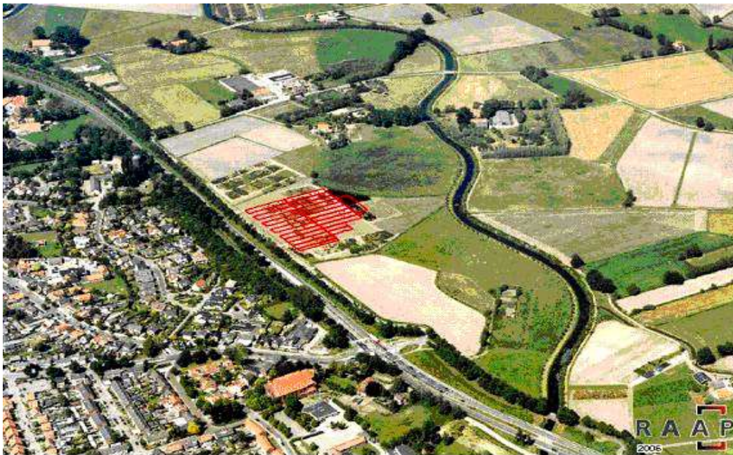
Het eerste deel van het grondgebied Bornse Maten (links van de Bornsche beek) met de plaats van de eerste opgraving.

In opdracht van de gemeente Borne heeft archeologisch adviesbureau RAAP Oost-Nederland een archeologische opgraving uitgevoerd in het plangebied de Bornsche Maten. Al in 2003 is er begonnen met de eerste onderzoeken. In verband met de planning van de bouwwerkzaamheden lag de prioriteit voor nadere onderzoeken in het gebied tussen de Rondweg en de Bornsche beek (1 e fase Bornsche Maten). In het najaar van 2004 is hier op een aantal plaatsen een zogenaamd proefsleuvenonderzoek uitgevoerd waarbij op de plaats van de voormalige Zuid Es de eerste goed geconserveerde nederzettingssporen werden aangetroffen.