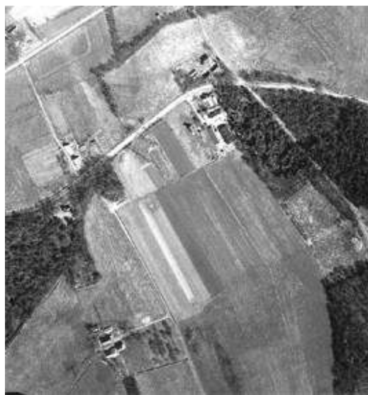
Luchtfoto van het café en aannemersbedrijf Platenkamp bij de kruising. Rechts van de kruising, in het bos, is nog te zien waar de afvuurstelling lag