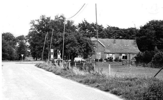
Café Platenkamp aan de Bornerbroeksestraat. Achter dit café in het bos was de afvuurstelling voor de V1 ingericht.