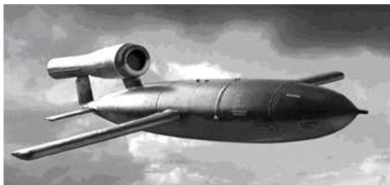
Het vergeldingswapen V1, lang 7,75 m, spanwijdte 4,9 m, gewicht ca. 2000 kg

De aangevoerde projectielen misten nog vleugels. Montage daarvan vond elders plaats. Van deze opslagplaats ging het transport met vrachtwagens naar de afvuurstellingen in Azelo en het Nijrees.