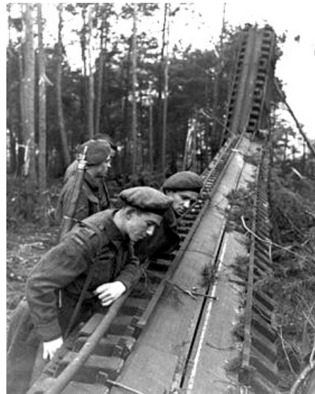
Een opgeblazen V1-lanceerinrichting in ogenschouw genomen door het Canadese bevrijdingsleger

De Directie van de Wederopbouw en de Volkshuisvesting, afdeling Financiën en oorlogsschade, keerde een schadevergoeding uit. De laatste termijn daarvan werd overigens pas in 1956 uitbetaald.