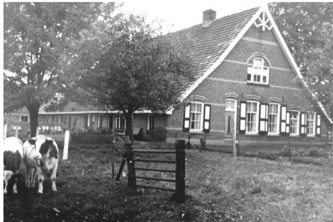
Erve Hilbrink in vroeger jaren

Het Krans esdorp Zendersche Esch heeft een grote cultuur-historische waarde en ligt ook nog eens in een landschappelijk zeer aantrekkelijk gebied. Ondanks de vele (honderden) jaren dat de erven deel uit maken van het landschap, staat het project Krans esdorp Zendersche Esch nog slechts in de kinderschoenen en moet er nog veel gebeuren om daadwerkelijk een tastbare link tussen de boerenerven te zien. Maar, de historische ondergrond is er al jaren!