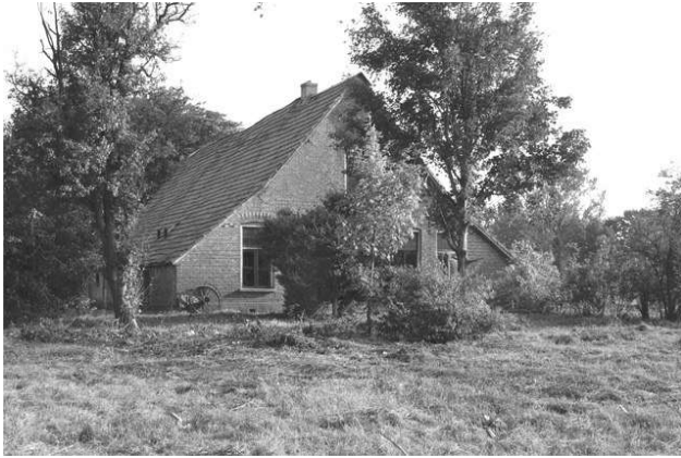
Erve De Zeilker