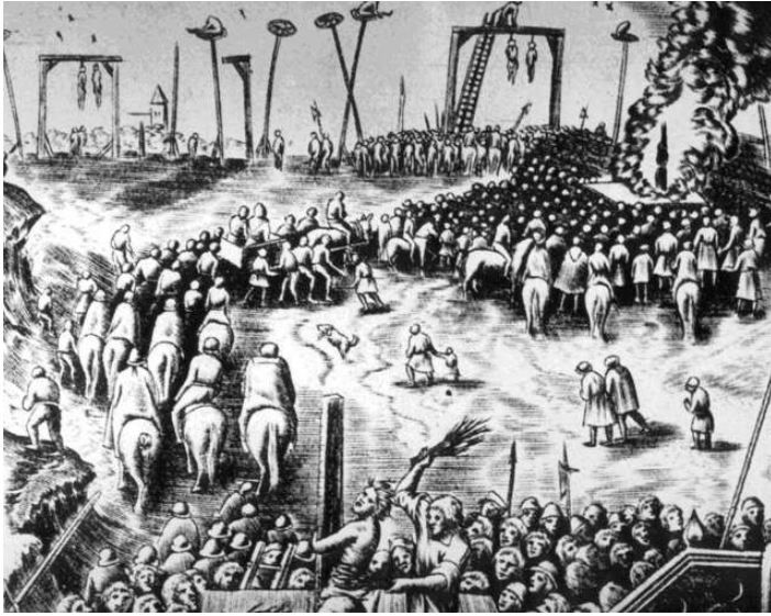
Fragment tekening Jeroen Bosch

onbekende personen opbrengen als boven. De mannen uit Agelo, Reutum, Fleringen, Albergen sullen mede, ieder in den haren (=eigen marke), de wegen en passen besetten, niemand onbekend zijnde doorlaten, en generalijk daaromtrent sig so verhouden (=te doen =zu verhalten), als hiervoren. Gelijk mede de setters van Tubbergen, met assistentie van soveel man als nodig zijn, insgelijks alle huysen sullen visiteren, insonderheid de herbergen en kroegen, alles ten fine als voorsch(reven). De oproep eindigt met: Alles bij poene van arbitraire correctie (=geld- en/of lijfstraf), ten laste der boerschappen of communititeiten, so dese ordres niet nauwkeurig agtervolgen. En eindelijk sullen deselve, ook na desen gestelden dag, sig allesins vaardig en gereed houden, om op de eerste ordre of aanzage dese selfde visitatie van nieuws te doen.