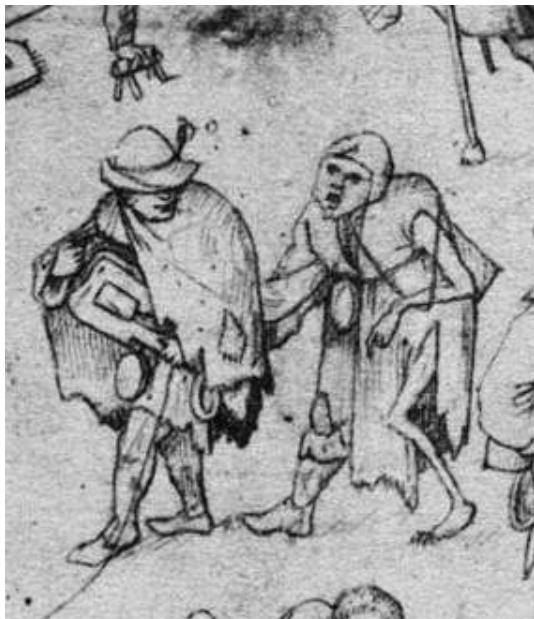
Fragment uit "Justitia" van Pieter Breughel

Diverse archieven bevatten nogal wat stukken over bedelaars, vagebonden, dieven, vecht- en moordlustigen, die afzonderlijk of in groepsverband opereerden. Dat was ook in Twente het geval en ongetwijfeld ook in de Graafschap Bentheim. Hoe komt het dat er in de tweede helft van de 18 e eeuw nogal wat bendes, zowel in Twente als in het graafschap, voorkomen?