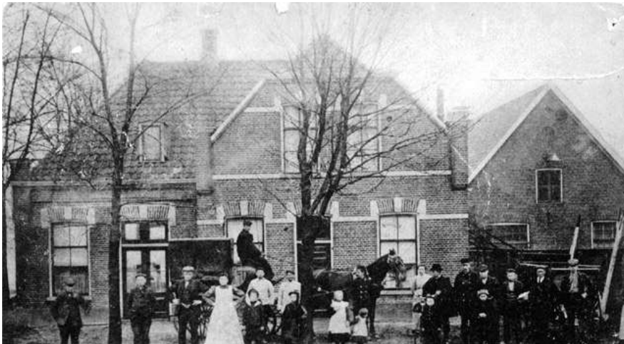
Tegenover het station aan de Parallelweg stond het koffiehuis van Krommedijk. Geheel rechts de zeepziederij.

De Bornse zeepziederij legde zich vooral toe op het maken van groene- en glycerinezeep. Deze zeep