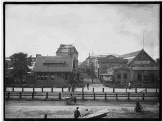
Het bedrijf Stork & Co in Hengelo

Nu wil ik u zeggen hoe ik meen dat de verhouding moet zijn tussen fabrikanten en arbeiders. Er zijn er die meenen dat die vijandig tegenover elkander staan, maar die hebben het glad mis; als het is zoo als het behoort te zijn, dan moeten we als goede vrienden met elkander omgaan. De werkman moet vertrouwen dat de fabrikant bij wien hij werkt, het