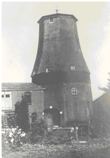
De molen ontdaan van de wieken, kap en stelling.

In september 1920 werd volledig overgeschakeld op het elektrisch aandrijven van de maalstenen en werden de wieken verwijderd door molenaar Tieskens uit Deventer. In 1946 is al het houtwerk en het riet verwijderd en bleef uitsluitend de onderbouw over. Deze is nog jaren gebruikt als opslag voor veevoeder. Tot 1970 heeft men gemalen met behulp van een elektromotor. In de Tweede Wereldoorlog is van het hout van de kap, die gemaakt was van Amerikaans grenenhout, meubilair gemaakt. Uiteindelijk is in 2003 ook de onderbouw gesloopt. De stenen van de molen zijn daarna verwerkt in het woonhuis op de hoek van de Oude Kerkstraat en de Marktstraat.