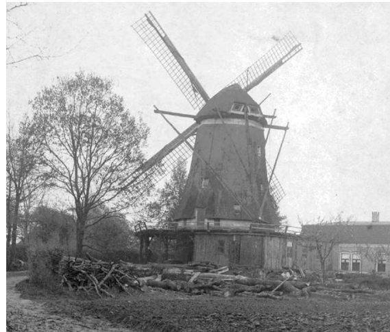
Zicht op de molen vanaf het Dikkerslaantje

pelmolen. In deze periode werden aan veel eigenaren dit soort vergunningen verleend. Omdat ook nog gewoon op de wind werd gemalen, werd de nieuwe stoommolen op ca. 50 m' van de windmolen geplaatst. In het gebouw komt een 8 pk stoommachine met een stoomketel. Deze stoommachine drijft door middel van riemen de maalstenen aan. In 1894, na het overlijden van de weduwe Dikkers worden verschillende onroerende goederen uit haar nalatenschap verkocht. Willem IJzereef koopt de Dikkersmolen voor f 6.115,-. Hij laat in 1896 vlakbij de molen een woning bouwen waar hij met zijn gezin gaat wonen. Eind 1896 vraagt hij een vergunning aan voor een bakkerij en in 1902 een vergunning voor de bouw van een houtzagerij die door de windmolen wordt aangedreven. Intussen heeft IJzereef in 1900 een stuk grond gekocht op de hoek van Beerninksweg en de Bornerbroeksestraat. Op deze plek vestigde hij een nieuwe houtzagerij, in eerste instantie aangedreven door stoommachines. Het bedrijf startte in 1905 en in hetzelfde jaar is de windmolen afgebroken.