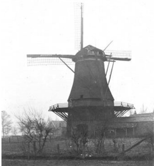
Zicht op de molen vanaf de Rondweg

De vergunning werd verleend onder de voorwaarde dat de molen binnen één jaar na dagtekening in gebruik moest zijn. Dikkers liet een achtkantige bovenkruier stellingkoren-pelmolen bouwen, in steen opgebouwd, gedekt met riet en opgebouwd 20 voet.