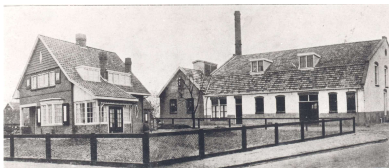
Melkfabriek aan de Ennekerdijk

ne combinatie van melkon-derzeuk boawen ('t lab) en et op 'n boer liggen. Zien wearkveeld op 'n boer, lag in Boorn en wied d'r om hen. Van halfweg Boornbrook en op Buren, tot achter Zeanderen, op 't Tusveeld, 'n Beveenkel en in 't Albeargerbrook. Heel Hettum tot an de Huzaar en vuurbiej de Kogelboer op Hengel an en