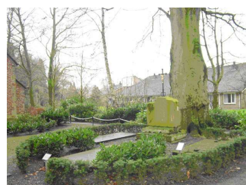
Het kerkhof achter de kapel