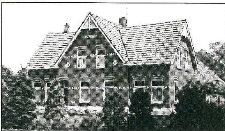
Erve Velthuis zoals het prachtige voorhuis van verre zichtbaar is vanaf de Velt-huisweg.

In 1795 wordt er weer een volkstelling gehouden (Lit. 7). Het blijkt dat de bevolkingsdruk enigszins is afgenomen, want in Hertme worden dan in totaal 208 personen geteld. Hierna volgen de namen van de hoofden der huisgezinnen, hun beroep en het aantal personen dat hun gezin telt. De volgorde der namen is zoals in de volkstellingslijst. Tussen haakjes wordt het nummer en de naam gegeven overeenkomstig de vorige aflevering (zie Boorn en Boerschop 2006 nummer -1-).