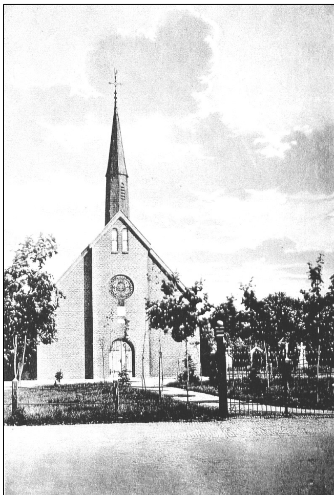
De in 1948 afgebroken waterstaatskerk van Zenderen met de beide gevelstenen.