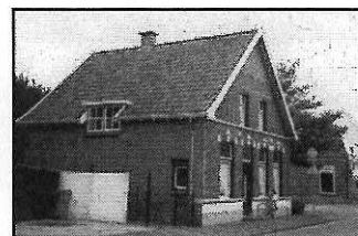
't Steerntje, Marktstraat 14