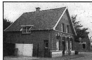
't Steerntje, Marktstraat 14