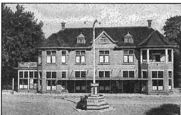
Hotel de Keizerskroon aan de toenmalige Markt waar de leden van de SS Polizei werden ingekwartierd.

Op 29 april 1943 maakte Wehrmachtbefehlhaber Friedrich Christianse bekend dat alle militairen van het voormalige Nederlandse leger in krijgsgevangenschap moesten worden gevoerd. Er braken in het oosten van het land proteststakingen uit. Bij textiel fabriek Spanjaard in Borne, die sinds 12 mei 1941 onder leiding stond van Verwalter Franz Reible, werd eveneens het werk neergelegd. Het Duitse opperbevel kondigde in de dagen daarop voor onder meer Overijssel het politiestandrecht af. Troepen van de Sicherheitspolizei werden naar Hengelo gedirigeerd. Het Sicherungsbereich Overijssel kwam onder leiding te staan van Hauptmann Wilhelm Martin Ney. In Almelo werd het SS Polizeibataillon 28 Todt gelegerd met aan het hoofd Hauptmann Helmut Bornhöfft. Een gedeelte van dit bataljon onder leiding van Oberleutnant Anton Wüscher, zo'n 30 man sterk, ging naar Borne en nam zijn intrek in Hotel De Keizerskroon aan de Markt. Zugwachtmeester was Otto Lauffenberg.