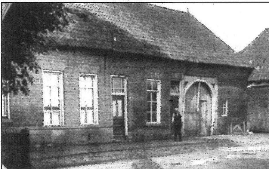
De herberg De Danneboom in de jaren twintig.

Turfhandel. Door de familie Ter Bekke is vanaf de beek Loo-lee een vaart gegraven (naar de huidige Bornsebeek) met het doel dat Vriezenveense turfschepen bij hun haven konden aanleggen voor de bevoorrading met Vjenneturf . Bij het erf stond ook een heujschuppe van 200 jaar oud en een turfloods, bestemd voor de opslag van de aangevoerde turf. Omstreeks 1851 kwam vanuit Vriezenveen (de toenmalige 2 e schippersplaats in Twente) de turfschipperij op gang via o.a. de Loo-lee naar Erve Bekman en Borne. Hendrik ter Bekke verhandelde de turf met paard en wagen naar Oldenzaal, Hengelo en Enschede. Later haalde Bekmans Graads , de knecht van Hendrik ter Bekke, de turf bij zijn turfstapelplaats bij de Dannebooms brugge . Deze was gelegen aan de huidige Azelerbeek (toentertijd Loo-lee) bij de brug in de Hoofdstraat in Zenderen. Op deze plek was daar in de 15 e eeuw al een herberg. Toen de turfschipperij op gang kwam, lag het voor de hand dat ook hier een turfstapelplaats kwam. Deze stapelplaats werd beheerd door Bekman. In de naastgelegen herberg Danneboom die eigendom was van de familie Ten Hulscher, konden de turfschippers terecht om te eten en om te overnachten. De turfhandel van Bekman heeft nog plaatsgevonden tot 1890 (bron 2, 3 en 4).