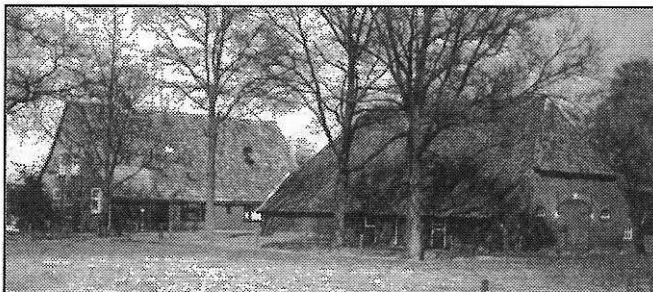
Het erve Esccherink (thans Esscher) aan de weg van Borne naar Zenderen, net voorbij boerderij Beerthuis.