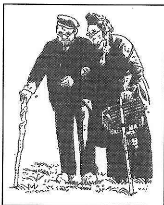
Oude noabers op weg naar een feest...

Het elkaar ondersteunen had vroeger een zeer goede invloed op de saamhorigheid in een buurtschap. Men deed veel samen, kende elkaar goed en hielp als vanzelfsprekend. Heden is dat echter zeer veel minder geworden. Men kent elkaar daardoor minder goed en ieder gaat meer zijn eigen gang. De toegenomen mobiliteit zal hiervan wel mede de oorzaak zijn. Ook de goede bereikbaarheid per telefoon zal zeker invloed hebben op deze gang van zaken. Verder het ontstaan van begrafenisverenigingen en -ondernemingen, alsmede de invloed van de kerk en de ontkerkelijking zijn hieraan waarschijnlijk debet.