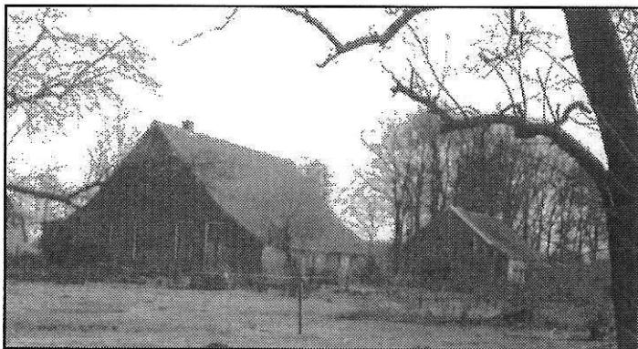
Het oude erve de Zeilker te Zenderen.