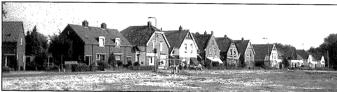
Deldensestraat met een bonte verzameling aan gebouwen...

De American Refined Motor Company was gevestigd in de in 1909 grotendeels door brand verwoeste machinefabriek die Ledeboer oorspronkelijk aan de Deldensestraat had gebouwd. In wereldoorlog twee werden de gebouwen door de Duitsers gebruikt voor opslag van materiaal. Aan het einde van de oorlog staken diezelfde Duitsers de gebouwen in brand. De tegenwoordige woonwijk ter plekke, “Het Refined”, is nog genoemd naar deze fabriek. De tegenover deze wijk liggende rij huizen, de “Rooie lap” is er nog steeds alsook de “ nieuwe burgerwoningen ” die verderop rechts van de weg een bonte verzameling van gebouwen blijkt te omvatten, samen met de daarachter gelegen Spanjaardwijk.