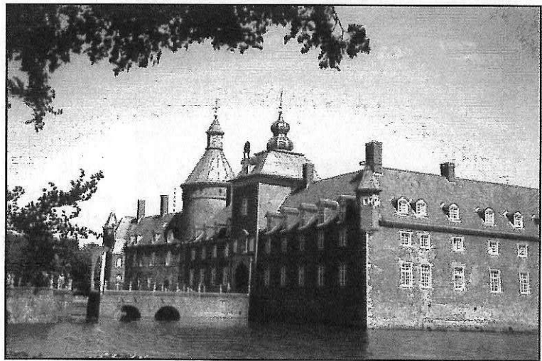
De fraaie voorgevel te zien tijdens de wandeling.

Een beschrijving van al het aanwezige moois zou te ver voeren, ik kan u beter aanbevelen om zelf te gaan kijken. Wat ik u echter niet wil onthouden is enige aandacht te besteden aan de aanwezige schilderijen, waaronder veel oude Nederlandse meesters. Het meest in het oog springend was een schilderij van Rembrandt uit 1635, getiteld "Diana met Actæon en Callisto". In de Griekse Mythologie was Diana de Godin van de jacht, Actæon was jager en kleinzoon van Cadmus. Hij zag toevallig de kuise Artemis (Diana) baden en werd voor straf veranderd in een hert en werd vervolgens verscheurd door zijn eigen honden. Callisto, een nimf, ging regelmatig op jacht met Diana; de geliefde van Zeus werd in een berin veranderd en aan de hemel geplaatst als sterrenbeeld. (grote beer).