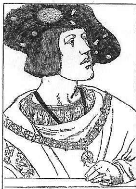
Karel V op jeugdige leeftijd.