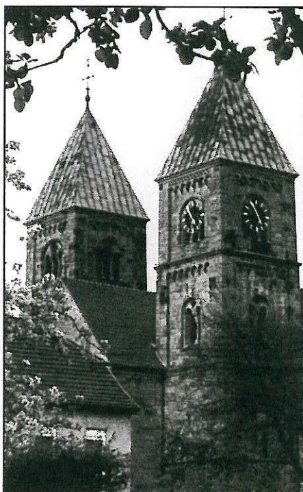
De Brigidakerk in Legden

Het kasteel lieten we achter ons om een deel van de oude kern van Legden te bewonderen. Ook hier vertelde onze gids tal van bijzonderheden. Er waren fraaie, helaas (nog) niet