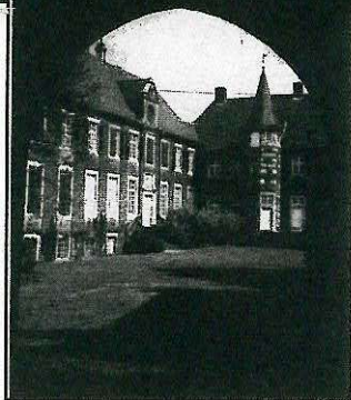
Het kasteel Egelborg zoals wij dat mochten aanschouwen.