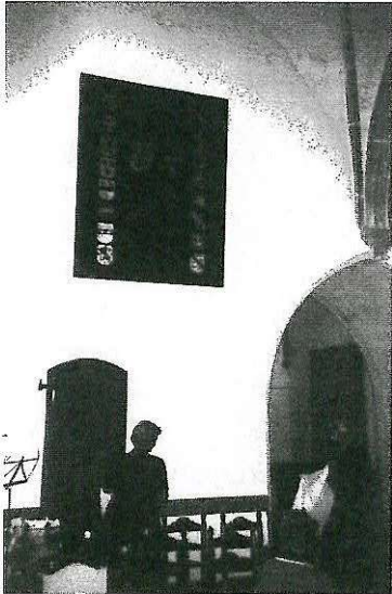
Het bord tijdens de onthulling op 9 september j.l.

Na de Franse overheersing keert hier en daar menig rouwbord terug. Zo niet hier in de Bornse kerk. Zo werd deze kerk gevrijwaard van de spot en de hoon van Hildebrandt in zijn "Camera Obscura": Maar wilt gij weten, wat ik bespottelijk, wat ik ergerlijk vind? Het zijn de wapenborden, Uw grafnaalden, Uw eerzuilen in de kerk, Uwe lofverzen op stof en assche, onder het oog van God en Zijn heilige huis op aarde, geschreven. Het zijn tropheeën van de dwaze trots, wereldse ijdelheid, nietige rijkdom, verwaande wetenschap, bloedige oorlog, daar te pronk gesteld, waar ootmoed en eerbiedigheid zich met gebukte hoofde voor het oog des Heeren stellen.