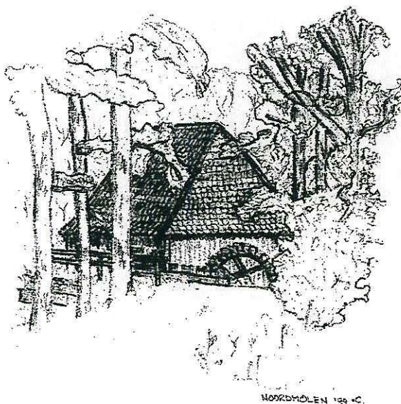
NOORDMOLEN 1994 C.