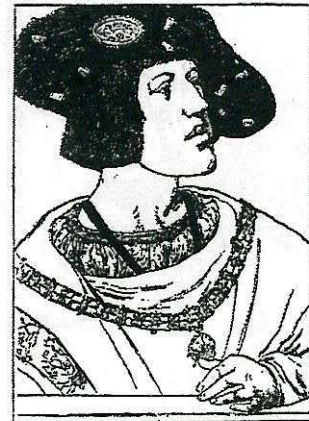
Karel V als jongeling.

In 1528 droeg de bisschop, ziende dat hij de wereldlijke macht niet meer kon uitoefenen en zich meer toeliggend op zijn eigenlijke taak, deze wereldlijke macht over aan Karel V. De strijd tegen Karel van Gelre en de Hollandse edelen, hadden de bisschoppen de voet behoorlijk dwars gezet. De meeste edelen, tijdens de reformatie overgegaan op de Calvinistische godsdienst, voerden strijd tegen de katholieke Keizer Karel V, zetelend in Spanje en baas over een Rijk waartoe ook het huidige Nederland behoorde. De edelen sloten een verbond met de bestuurders van de steden in de diverse gewesten (te vergelijken met de huidige provincies) en leverden voornamelijk in het huidige west-Nederland, strijd tegen de Spaanse Keizer. De 80-jarige oorlog was een feit.