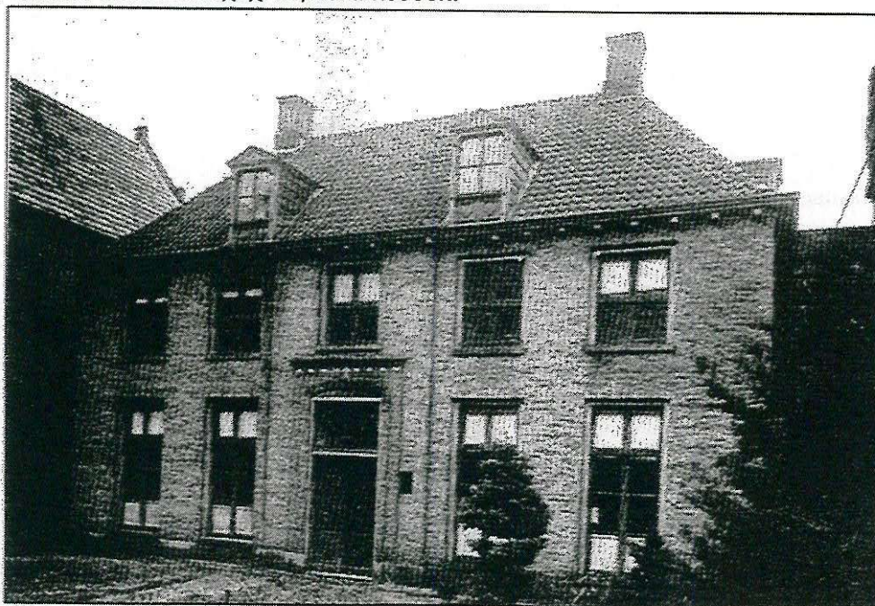
Het oude gebouw "Huis ten Hulscher".

Het officiële bestaan der inrichting van het Gymnasium dagtekent van 12 januari 1890; op die dag werden door den HoogEerw. Pater Provinciaal der Carmelieten op plechtige wijze eenige localiteiten van het klooster tot dat doel ingezegend; deze localen bevonden zich in den nu nog bestaande ouden bouw van het klooster, het eigenlijke "Huis ten Hulscher", waarin in 1854 de Zenderensche kloosterstichting begonnen werd en waaromheen zich in den loop der jaren de nieuwe gebouwen gegroepeerd hebben.