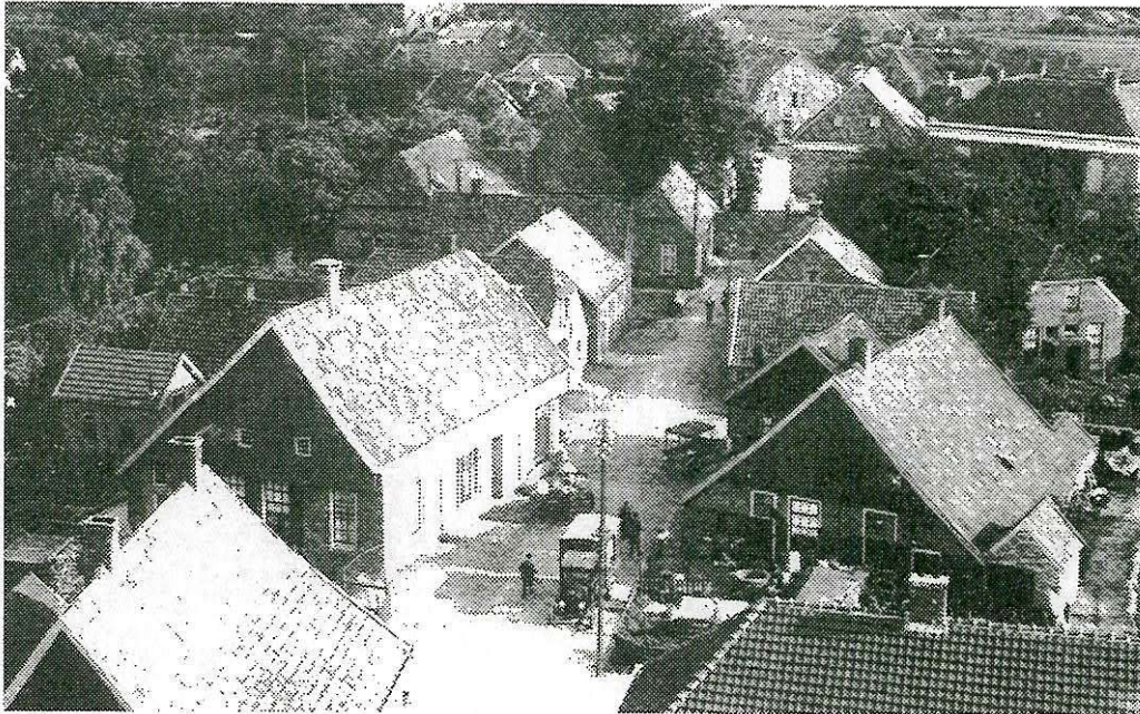
...huizen als door een reuzenhand gestrooid..., hier de A. ten Catestraat.

De markt (nu het Dorsetplein) vormde het centrum van het dorp; daar kwam men te zamen, daar werden de oorlogsberichten voorgelezen, daar stopte de postkoets voor het logement (De Keizerskroon), daar werd de politiek behandeld; in één woord, daar concentreerde zich het geheele dorpsleven.