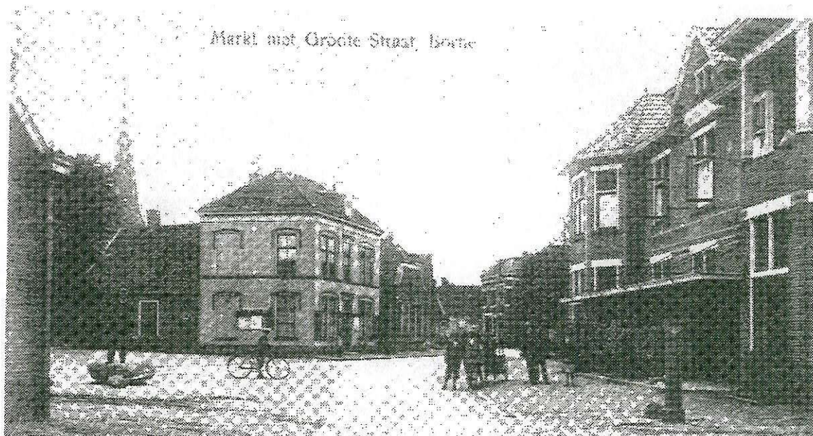
De Markt, thans Dorsetplein, in vroeger jaren met links de kei die toen al niet meer door de statige linde werd overschaduwd...

In een volgende aflevering zullen we de teksten in het boekje verder bekijken.