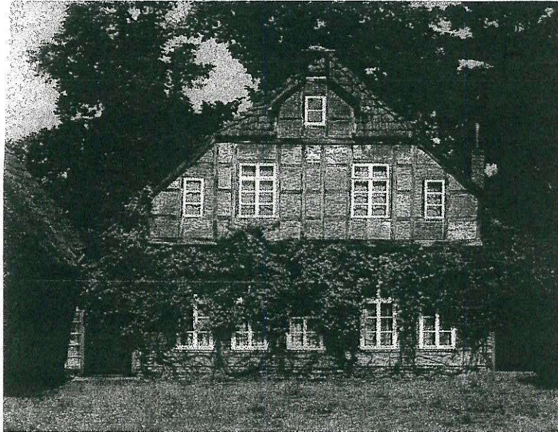
Huize De Camp.