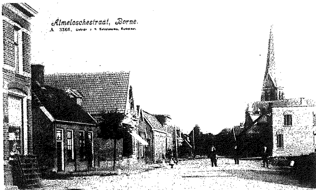
Het huisje links vooraan (perceel 560) staat op de plaats waar nu de ingang is naar de parkeerplaats achter de nieuwbouw van de voormalige ijzerhandel Ter Haar.