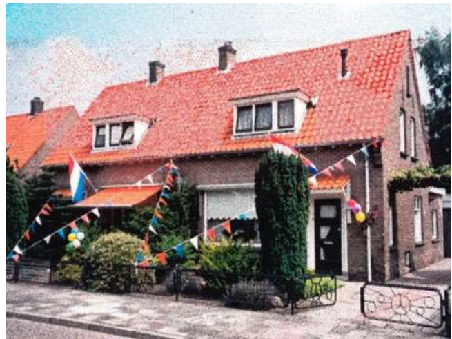
De woningen aan de Oude Almeloseweg feestelijk versierd bij gelegenheid van het 50-jarig jubileum in 1998.

In het voorjaar van 1946 verschijnen er advertenties in de Bornse Courant van jonge stellen voor de huur van een gedeelte van een woning. In de gemeente-