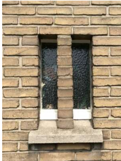
Bijzondere details uit het ontwerp. Het toiletraam met zandsteen dorpel en de gemetselde rondboog met terugliggend siermetselwerk boven het kleine raam.

nr. 26 het gezin H. Eleveld uit Emmer Compasuum