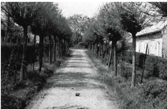
Boven en onder: het oprijlaantje naar de begraafplaats.