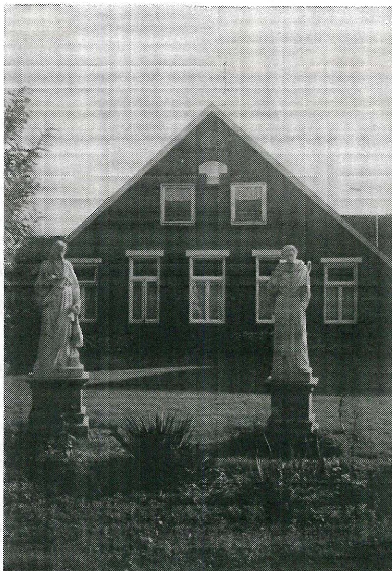
Thans staan de door Leuverink en Mensink gerestaureerde beelden van Dr. Schoemaker voor de Hemmelhorst te pronken.

Een halve dag werk op de Hemmelhorst wordt beloond met aftrek van 25 cent. Een boom brengt de betrokkene een gulden op, een halve vette gans 60 cent en honing 12 cent per kilo. een riem rogge, gerst of haver rekent hij op fl.5,00 tot fl. 7,00. Een voer (wagenvracht) hooi komt op fl. 6,00 en een schuit turf op fl. 9,00. Een voorbeeld van het vereffenen van zo'n rekening is de volgende. Boer Mettinkhof uit Hassello, ontvangen tussen 1834 en 1853: aan hout, werk, haver en rogge fl. 78,80; geleverd aan visites en medicijnen fl. 84,55, rest fl. 8,75 werd als "voldaan" weggestreept. De slager, die bij hem voor fl. 4,00 in het krijt stond, betaalde met 20 pond vlees.