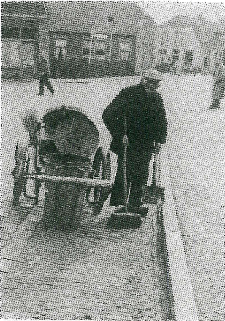
Met batse en bessem 't milieu van Boorn op peil holen...

Op nen oalen film oawer Boorn wördt-e ofgeschilderd as "De man die altijd werkt", en zo was 't ok. 't Milieu van Boorn dodertied, op peil holen. Met batse, bessem en 'n soort bakfietse peerdeköttel van de stroat opnemmen en de götten ankeren. 't