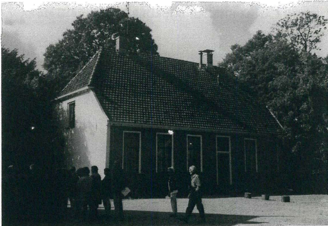
Het Juffershuis bij erve Het Bartelink.