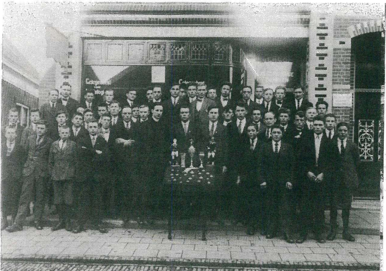
Leden van NEO vierden in 1924 het 50-jarig bestaan van hun voetbalvereniging in het zojuist geopende geheelonthouderscafé Sobrietas.