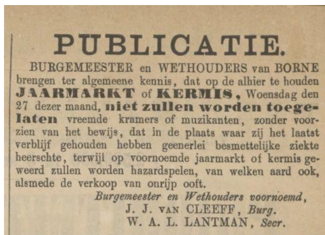
De gemeente Borne probeerde onder meer besmettelijke ziekten buiten de gemeente te houden door verklaringen van kermisklanten te vragen.

de kosten daarvan. Ook in dat jaar kwam tyfus veelvuldig voor en de gemeente nam daarop strengere maatregelen. Alle verzamelingen van mest en ander vuil werden opgeruimd en de ingezetenen kregen kosteloos ontsmettingsmiddelen tot hun beschikking. De verschillende goten en sloten werden gereinigd en uitgegraven. De uitwerpselen van de zieken werden 's morgens en 's avonds aan de wonin-