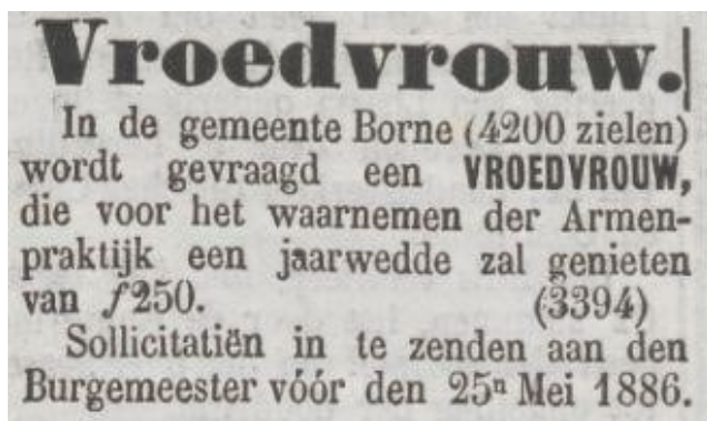
Advertentie uit 1886 voor een vroedvrouw ten behoeve van de armenpraktijk.

Borne had een huisarts en een verloskundige. Er was geen sprake van een algemene zorgverzekering of ziekenfonds. In de Provinciale Overijsselsche en Zwolsche Courant en de Tijd van 20 januari 1891 vraagt de burgemeester van de gemeente Borne een vroedvrouw 'voor de waarneming van de armenpraktijk'. Het salaris bedraagt fl. 300 per jaar. Behalve de armenpraktijk mag op 110 bevallingen per jaar worden gerekend, aldus de advertentie in de Provinciale Noordbrabantsche en 's-Hertogenbossche Courant van een dag eerder. Drieënhalf jaar eerder was er ook al een vroedvrouw gevraagd (De Tijd 13 mei 1886). Het jaarsalaris bedroeg toen fl. 250.