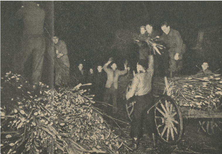
Het rijshout wordt op wagens geladen.

bij de actie het meest opviel is de grote spontaniteit die de gehele bevolking aan de dag heeft gelegd. Het is een bekend feit dat in Borne de tegenstellingen groot zijn en er weinig voor nodig is om in deze gemeente een rel te veroorzaken, doch in deze dagen, nu landgenoten in nood verkeerden, wist Borne wat haar plicht was en Borne heeft haar plicht ge-