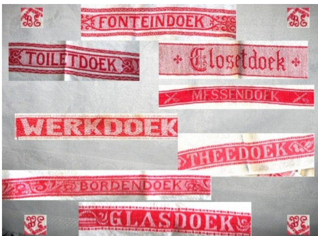
Voorbeelden van soorten doeken uit de fabriek van de familie Elias uit Strijp. Het merk Elias bestaat nog steeds.