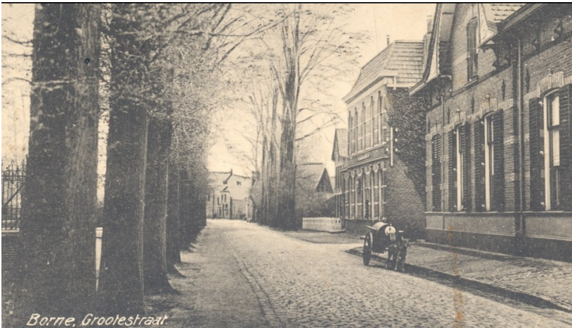
De Grotestraat aan het begin van de twintigste eeuw. Geheel rechts het huis Van der Wijk.