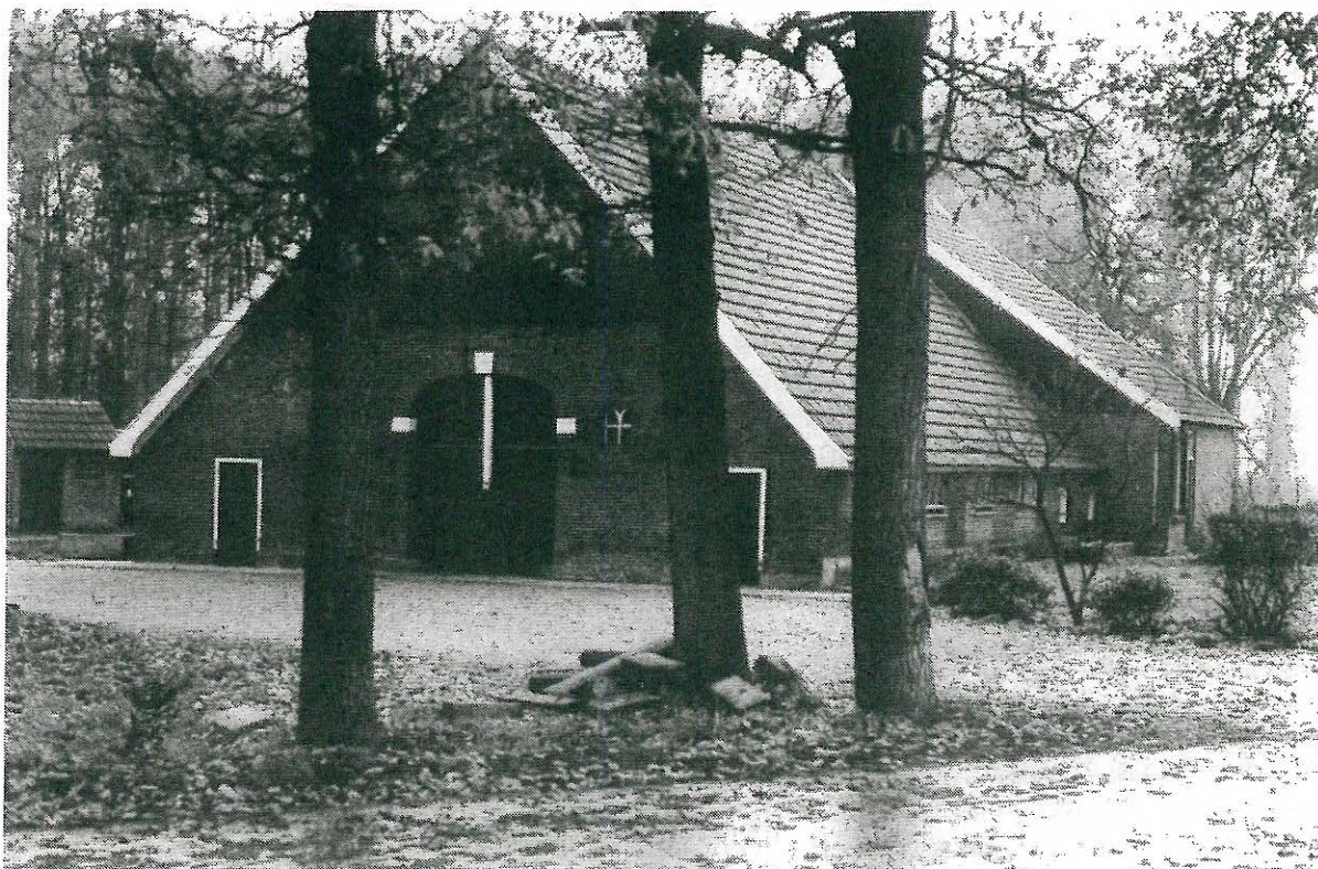
De boerderij Konink (of Cönnink) op Buren.

derij van de kerk Hengelo, uit dit "huisarchief" afkomstig. Het betreft een boekje van ong. 11 x 17 cm met het nummer 270. Op 7 april 1693 hadden Ridderschap en Steden van Overijssel besloten "Dat de Rentmeesters, aen ieder Debiteur, en principalyck de boeren, in 't Rentampt horende, sullen versorgen dat ieder een boekien heeft, om daer in te kunnen quiteren", en dit tegen een boete van 100 goldguldens (voetnoot RAO Zwolle Toegang 214 nummer 287). Huis Hengelo heeft dit - geen staatsbezit zijnde - ook gedaan en deze boekjes genummerd. Dit (hoge) nummer 270, zal waarschijnlijk niet het aantal objecten die geld opbrachten zijn. Het was mogelijk het volgnummer van stichting of opvolging als het betreffende object aan een andere persoon werd verhuurd. In het bovenomschreven boekje werd jaarlijks de pachtafdracht genoteerd. Of de pachter jaarlijks de gang naar de penningmeester/kerkeraad/rentmeester (van het Huis Hengelo) maakte of dat de ontvanger zich op het erf vervoegde is niet te achterhalen. Voor de hand ligt dat het laatste het geval zal zijn geweest, omdat hij dan tevens zicht had op de materiële toestand waarin het erf zich bevond. Opmerkelijk is nog dat de pacht volledig in geld moest worden betaald en niet meer zoals gebruikelijk (gedeeltelijk) in rogge, haver, varkens, kippen.