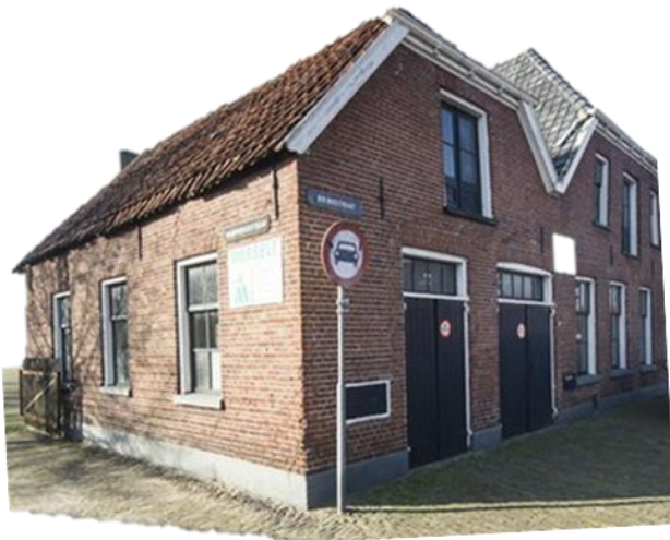
Het drie eeuwen oude pand van Morselt; eerst fungerende als bakkerij, vervolgens als herberg 'de Gouden Schaaf' en daarna als timmerwerkplaats, dient het binnenkort na een zeer grondige renovatie als woonbestemming.