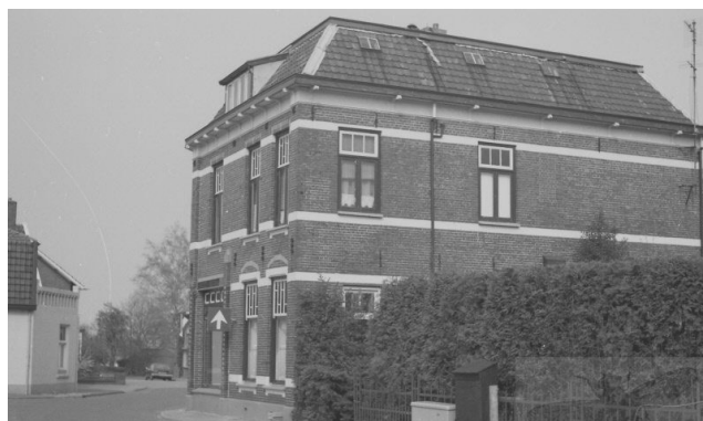
De Koppelsbrink. Rechts de woning van bakker Homan.

Simon kon ook hypnotiseren. Toen hij wat ouder was had hij zich daarover een paar boeken aangeschaft en deed hij het al aardig, naar men zei. Op een feestavond in Hengelo kwam hij echter een keer in moeilijkheden. Hij had nl. een meisje languit op drie stoelen gelegd en in slaap gebracht. Dat gelukte wonderwel, want toen hij de middelste stoel weghaalde, bleef het wicht in dezelfde houding met alleen de steun van haar hoofd en voeten rustig doorslapen. Toen hij haar weer wilde bijbrengen wist hij waarschijnlijk niet meer hoe de formule was