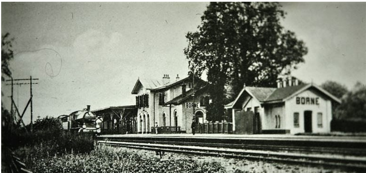
Een trein met Limburgse vluchtelingen stopte in februari 1945 op het station in Borne. Hij was zo lang dat de overgang van de Azelosestraat er door werd geblokkeerd.