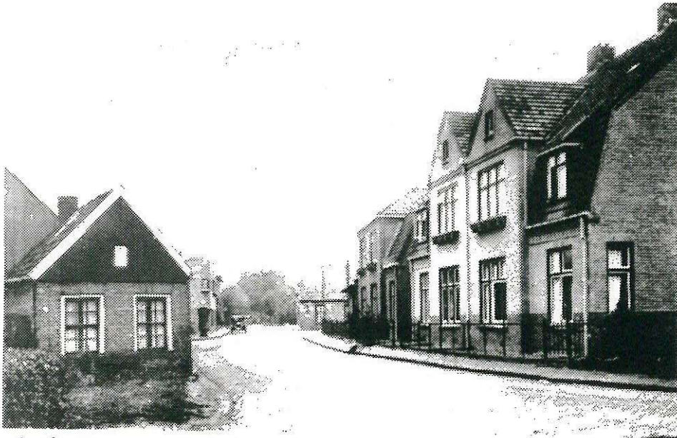
De herenhuizen van Spanjaard aan de Grotestraat, gebouwd in of kort na 1923 (v.r.n.l. No. 137, 135, 133 en 131) en daarna het in 1913 gebouwde pand No. 129, op de hoek van de Aanslagsweg.

Het na de sloop van de oude woningen aan de Hengeloschestraat vrijgekomen terrein werd later ook weer bebouwd. Hier verreezen de herenhuizen van Spanjaard, waarvoor B & W op 11 september 1923 vergunning verleenden. Op bijgaand deel van een ansicht-