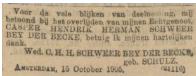
Advertentie uit het Algemeen Dagblad van 16-10-1905.