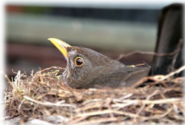
'n Geeteling (merel) op 't nus.