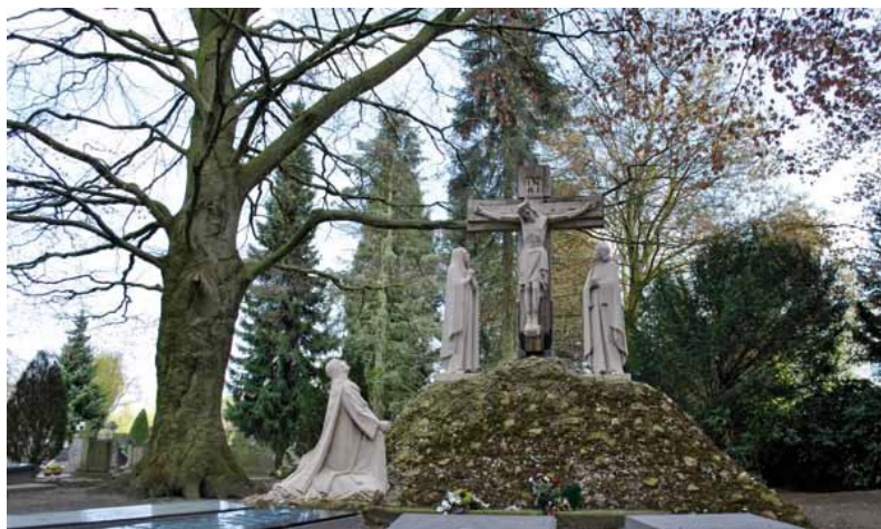
De Calvarieberg is rond 1932 opgericht en ligt op het oudste gedeelte van de begraafplaats. De Calvarieberg, of ook wel kruisberg genoemd, is de oorspronkelijk buiten Jeruzalem gelegen heuvel waar Jezus gekruisigd werd. Op de berg staat een Christusfiguur aan het kruis met drie