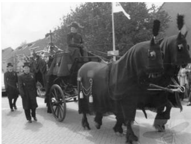
Lijkkoets met paarden en dragers. Zoals toentertijd gebruikelijk een zwarte koets en paarden met zwarte dekkleden en zwarte leidsels.