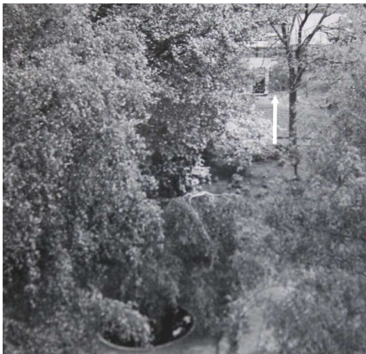
De schuilkelder achter in de tuin.

met een trap naar beneden. Van buitenaf leek het een dijkje. Hij was zes meter lang en zo'n twee meter breed. Aan weerszijden stonden banken. De kelder had een nood-wc, met daarboven een vluchtgat. Er stond ook een kast met wat voorraad en om spullen in op te bergen. Daarin lag ook Ria's fotoalbum, dat haar dierbaar was.