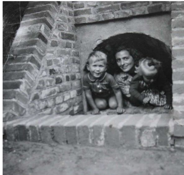
Het vluchtgat van de schuilkelder

Later werd er een veiliger schuilkelder achter in de tuin gebouwd. De kelder was ondergronds, je ging