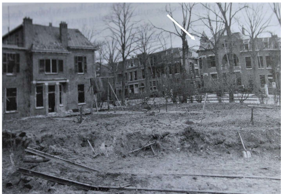
Het huis van de familie Janssen na een bombardement.

Om twaalf uur liep ik met een vriendinnetje, al knikkerend in de goot, naar de tramhalte op de Burchtstraat, want wij gingen tussen de middag met de tram naar huis om te eten. Wij misten de eerste tram en toen ging het luchtalarm. Wij renden naar de halte en schuilden een uur lang in een winkel tot het sein 'veilig' klonk. Wij konden toen met de volgende tram mee. Maar na een paar haltes, bij het Kronenburgerpark, ging opnieuw het alarm. Iedereen vluchtte de tram uit en zocht een veilig heenkomen. Wij schuilden tegen een winkel op de hoek van een straat. Het sein 'veilig' kwam echter niet meer. Wij hebben daarna geschild bij vrienden van de ouders van mijn vriendinnetje. Daar werden we in de gang op de trap gezet om niet te kunnen zien wat zich buiten afspeelde. Dat was heftig: handkarren en wagens met paarden ervoor trokken voorbij met gewonden, op weg naar de ziekenhuizen. Die route moest ik ook lopen naar de Sint Annastraat. Dat durfde ik