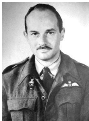
F/O Ab Homburg alias Clive Homburg

Zoals eerder gesteld waren delen en onderdelen van het vliegtuig aan de Oude Veenweg over een vrij groot gebied verspreid. De Duitsers hebben deze resten laten liggen, gevaarlijke onderdelen hadden ze reeds weggehaald. Veel onderdelen van het vliegtuig zijn naderhand terug gevonden bij bewoners in de omgeving. De canopy (Cockpit) en het staartwiel van de kist zijn later in het museum op de vliegbasis Twente terecht gekomen. Nu zijn deze onderdelen terug te vinden in het oorlogsmuseum "Icarus et Mars" 7) in Assendelft (Noord-Holland) waar speciale aandacht wordt gegeven aan Ab Homburg, niet alleen als vlieger, maar ook als Engelandvaarder. Ab Homburg is als Engelandvaarder onderscheiden 8) met de "Bronzen Leeuw" en een eervolle vermelding. Als vlieger ontving hij het "Bronzen Kruis".