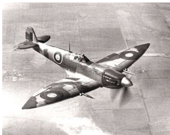
Spitfire MK XV

Om zicht te krijgen op de situatie van de oorlogsgebieden, en ter ondersteuning van de grondtroepen werden geallieerde vliegtuigen ingezet. Op eerste paasdag 1 april 1945, 11.30u, stegen hiervoor vanaf de (nood)vliegbasis Schijndel (ca. 12 km ten noorden van Eindhoven), een tiental geallieerde vliegtuigen (Spitfires MK XVI) op. Zes Nederlandse, twee Franse, een Noor en een