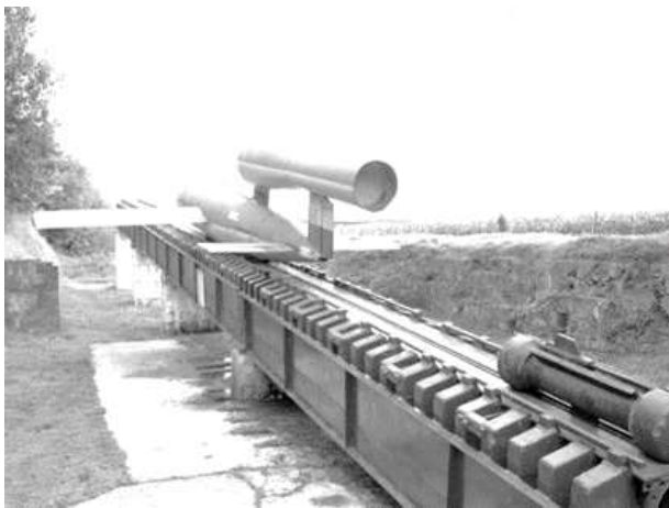
V1 op de lanceerinrichting

Nadat Antwerpen in september 1944 door de geallieerden was bevrijd, wilden de Duitsers voorkomen dat deze plaats met zijn zeehaven, een aanvoerplaats zou worden de geallieerden. Met grondtroepen en tanks was de stad voor de hen niet meer bereikbaar. Ze besloten dan ook versneld hun langeafstandswapen de V1 in te zetten. Hiervoor zochten ze in het najaar van 1944 naar geschikte plaatsen voor het opstellen van lanceerplaatsen. In de omgeving van Borne werden die gevonden in het