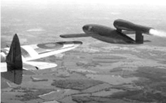
Spitfire VI onderschept een V!

Engelsman vormden de bemanning. De opdracht was verkenningen uit te voeren in het gebied van Zwolle, Deventer, Hengelo, Enschede en Lingen. Waar mogelijk moesten vijandelijke stellingen en voertuigen worden uitgeschakeld. Voorts diende ook de mogelijke beweging van het vijandelijk Duitse troepen te worden gevolgd.