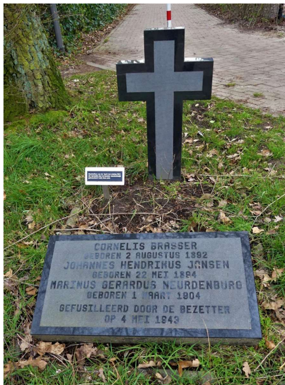
Monument aan rondweg ter hoogte van de voormalige Theresiakerk