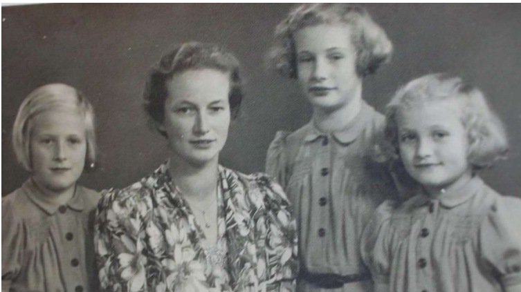
Moeder en dochters