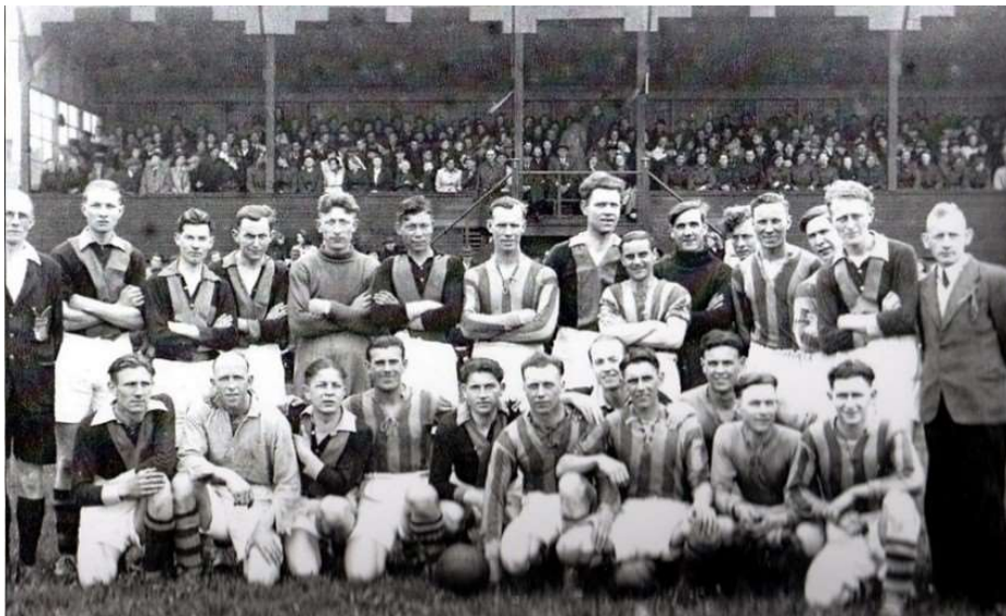
Mei 1945: BVV Borne voetballt tegen de bevrijders van het Engelse Dorsetregiment