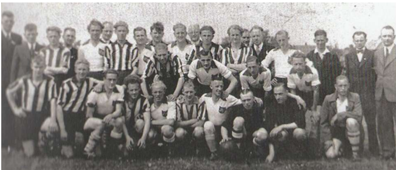
Mei 1945: BVV Borne voetballt tegen de bevrijders van het Engelse Dorsetregiment (in verticaal gestreepte shirts)

is niet ver verwijderd van het Hogeland, een stadswijk van Enschede. Halverwege de match, bezocht door talrijke toeschouwers, horen we het geronk van vliegtuigen. Even later zien we boven het Hogeland Amerikaanse bommenwerpers, achtervolgd door schietende Duitse jagers. Om aan hen te ontkomen moeten de bommenwerpers hun zware ballast kwijt. Ze openen de kleppen van hun kisten en laten ter plekke hun bommen vallen. De scheidsrechter blies net voor het rustsignaal. De spelers en het publiek, die het gevaar dichterbij zien