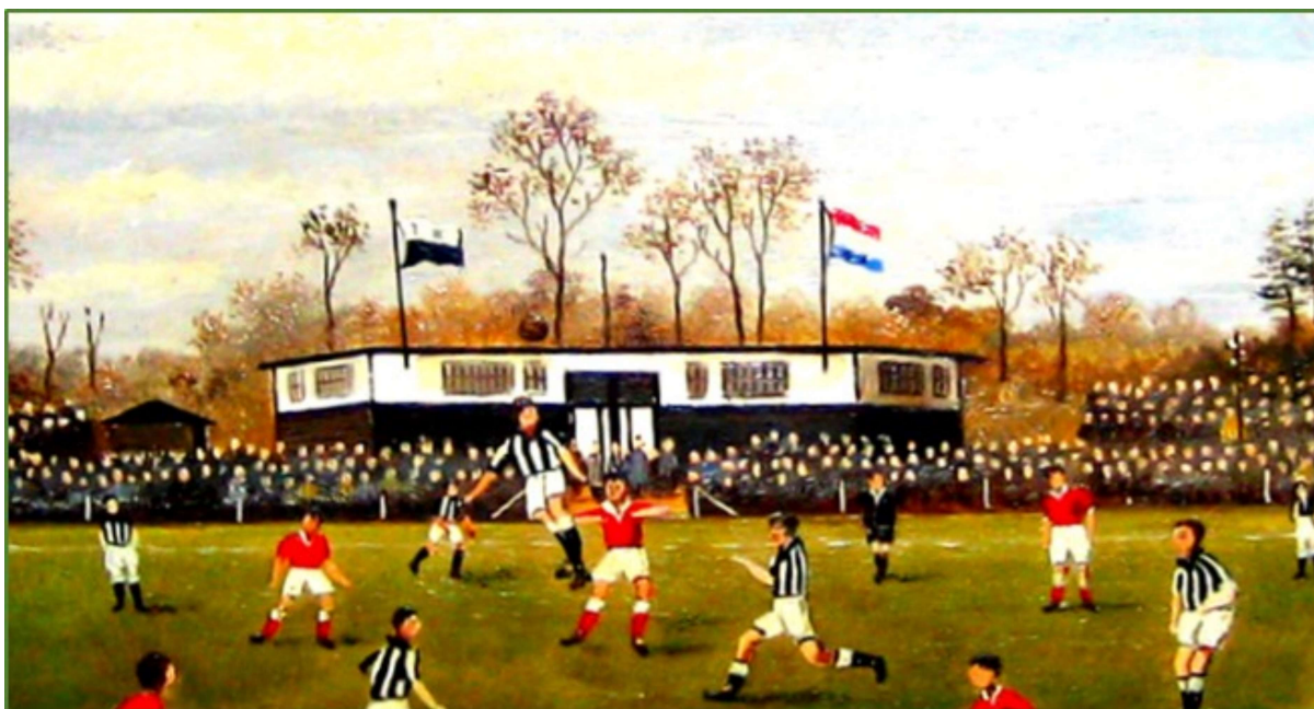
Een impressie van het hoofdveld met kleedkamers van NEO in de jaren veertig aan de Deldensestraat/ Leemweg. Het terrein stond bekend onder de naam "Achter de dennen".

Bronnen:- BVV Borne 100 jaar. 'Waar de witte huizen staan' (periode 1939-1945) -NEO 100 jaar jong. Een eeuw kleurrijk zwart-wit ('NEO tijdens de tweede Wereldoorlog'/ Harry Filart en Leo Leurink) -Plaatselijke en regionale krantenartikelen uit de oorlogstijd.